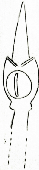
löpartenens övre fäste